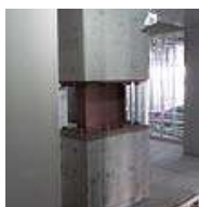
免震装置(積層ゴム)