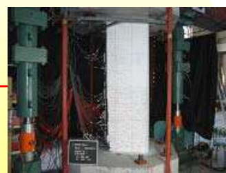
コア耐震壁工法 (加力実験の様子)