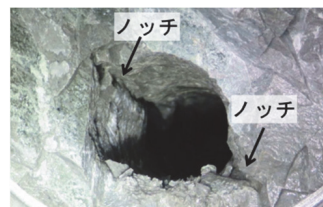
写真-1 ノッチの形成状況

現場実験では、余掘り低減に対するノッチの効果を検証するため、トンネル外周装薬孔にノッチを形成して発破する実験を孔あたり装薬量の条件を変えて行った。なお、実験では、地山性状の違いが発破掘削の結果に及ぼす影響を極力避けるため、同一の切羽を左右に分けてノッチ付き発破（外周装薬孔にノッチを形成）と標準発破を実施した。