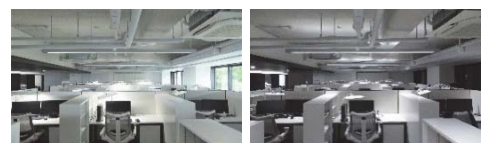
写真-1 オフィス(左：日中 右：夜間)