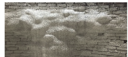
写真-1 吹付け面の仕上がり状態