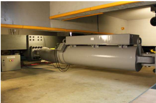
減衰可変ダンパー